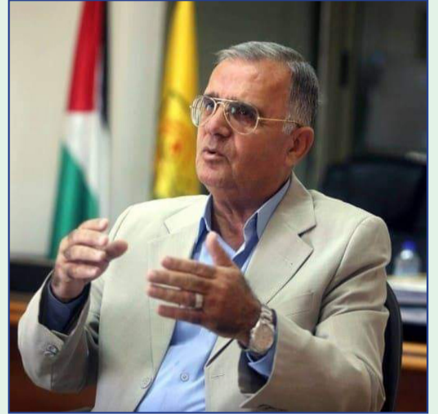
سفير دولة فلسطين بالجزائر أمين رمزي مقبول

كما نشرت الحركة البناء الوطني على صفحتها الرسمية في فيسبوك بيان ثمنت حركة البناء الوطني تصريحات رئيس الجمهورية برفض سياسة الهرولة نحو التطبيع وتجديد التمسك بالحقوق الفلسطينية المشروع في إقامة دولته