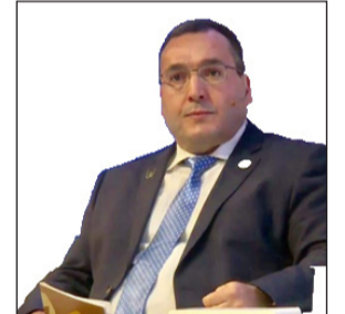
البروفيسور جمال عباس

لم يعد مهما في زمننا هذا أين درست وماذا تخرجت وعلى أي شهادة تحصلت؟ بل المهم والأهم ماذا ستقدم لو توظفت، ولم يعد مقياس النجاح هو الحصول على الشهادة الأكاديمية فهناك أشخاص متفوقين في العالم لم تطأ أقدامهم الحرم الجامعي، كما أن قضاء 4 أو 5 سنوات في الجامعة لا يجعل منك شخصا ذكيا ولا موهوبا لا سيما إذا كانت المنظومة التعليمية غير مصنفة وتعتمد على التلقين وتختبر الحفظ وليس الفهم وخاصة ان كنت ممن يعتمد على المراجعة قبيل « ليلة الرعد » لاجتياز الاختبارات. لقد أحسن الرئيس الأمريكي دونالد ترامب صنعا عندما أصدر بروتوكول جديد للتوظيف في فروع الحكومة الفيدرالية يركز على المهارات بدل الشهادات وان كانت كبريات الشركات الأمريكية في وادي السيلكون أو مجال الاستغلال الطاقوي قد سبقت إلى ذلك منذ وقت معتبر فشركة غوجل مثلا أجرت تحليل لنسب نجاح موظفيها فتوصلت إلى أن التحصيل العلمي لا يحتفظ بصلة وثيقة مع بيئة العمل وفي هذا الصدد