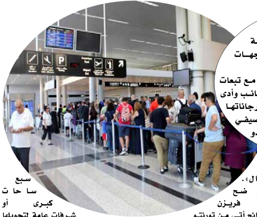
سبع ساعات كبرى أو شرفات عامة لتحويلها

و سيستفيد مشروع فيلم «هاجر» لأنيس ساعد و «صولا» لصالح ايسعد من ورشة «Final cut invenice» وهي طريقة أخرى للبحث عن تمويل للأفلام في مرحلة ما بعد الانتاج.