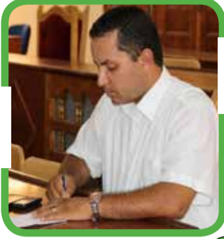
الكاتب: بوجمعة مهناوي-الجزائر